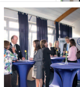
Rund 50 Gäste empfing die Stiftung Gesundheit in ihren Räumlichkeiten in Hamburg-Altona.

Am 10. Mai 2011 findet der Jahresempfang 2011 statt – mit der Vorstellung der Publizistik-Preis-Gewinner, einem Referentenvortrag und Get-together.