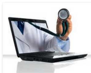
Suchmaschinen-Experten für den Medizinmarkt finden sich unter www.medizin-seo.de

Das wichtigste Bewertungskriterium ist der Inhalt einer Homepage. Google durchkämmt Ihre Website nach allen Worten, die es dort finden kann. Schreiben Sie also viel Text auf Ihre Seiten – allein mit Ihren Kontaktdaten kann Google wenig anfangen.