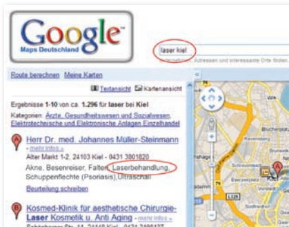
Teilnehmer der Arzt-Auskunft sind über Google Maps anhand ihrer Schwerpunkte zu finden.

Doch die Kartensuche kann noch mehr. Seit Anfang dieses Jahres sind dort auch Deutschlands Ärzte, Zahnärzte und Psychologische Psychotherapeuten zu finden. Der Hintergrund ist: Google Maps hat die Arzt-Auskunft der Stiftung Gesundheit lizenziert.