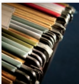
Datenschutzmissachtung kann den Praxisverkauf gefährden.

Bei dem Verkauf oder der Übernahme von Arztpraxen dürfen Patientenakten nur mit der Einwilligung der Patienten an den neuen Eigentümer übergehen. Ist die Kartei dennoch Teil des Übergabevertrags, macht sich der Vorgänger strafbar, da er gegen die ärztliche Schweigepflicht verstößt. Als Folge kann der gesamte Übernahmevertrag zwischen den Ärzten unwirksam werden (BGH, Az: VIII ZR 25/94). Auch ein einfaches Informations-