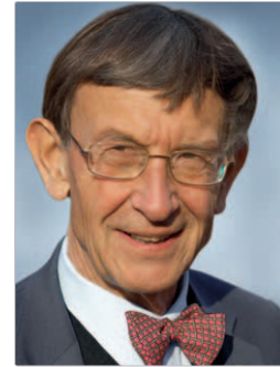
Prof. Dr. Heinz Riesenhuber, MdB, Alterspräsident des Deutschen Bundestages und Bundesminister a. D. für Forschung und Technologie