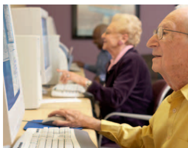
Anwenderfreundliche Websites sind so strukturiert, dass sich auch im Internet unerfahrene Nutzer zurechtfinden.

So schaffen Sie mit einfachen Mitteln mehr Übersicht für Ihre Besucher