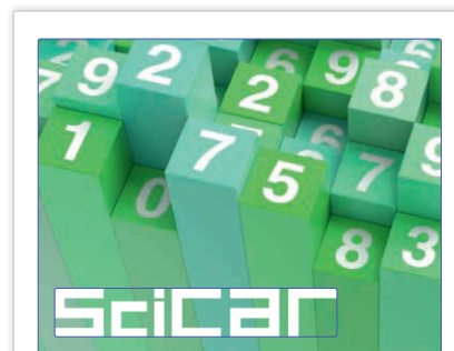
Die SciCAR-Konferenz bringt Wissenschaftler und Datenjournalisten zusammen – 2020 allerdings nur digital.

Mehr Informationen finden Sie unter www.stiftung-gesundheit.de , Webcode: Arzt-Explorer