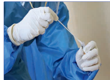
Rund 7.000 Corona-Teststellen sind in der Arzt-Auskunft verzeichnet.

Über die öffentliche Arzt-Auskunft sowie die Professional-Variante finden Patienten und Lizenzpartner, etwa Krankenkversicherer, Corona-Teststellen, -Schwerpunktpraxen sowie -Impfzentren. Und das – wie gewohnt – aktuell recherchiert und gepflegt von unserem Adressrecherche-Team.