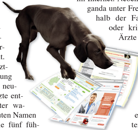
Die Spürnase im Netz bewacht Ihren guten Namen

Mittlerweile tummeln sich mehr als ein Dutzend Arztbewertungsportale im Internet. Neben der Mund-Propaganda unter Freunden oder innerhalb der Familie empfehlen oder kritisieren Patienten Ärzte nun auch übers