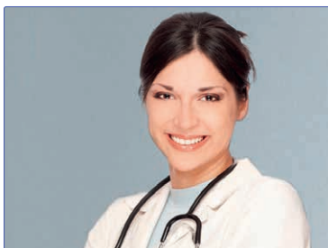
Journalisten veröffentlichen neben Zitaten oftmals Porträtfotos der Zitatgeber. Nutzen Sie diese Chance – mit dem richtigen Bild.

Ein gutes Porträtfoto erzeugt Auf-merksamkeit, spricht den Betrach-ter an und weckt im besten Falle Sympathie. Damit Ihnen dies ge-lingt, sollten Sie folgende Punkte beachten: