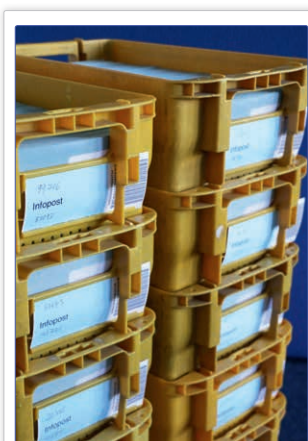
Nur ein aktuelles Verzeichnis wird den Ärzten vollumfänglich gerecht. Deshalb steht die Stiftung beständig in Kontakt mit sämtlichen aktiv am Patienten tätigen Ärzten.