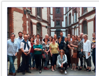
Entwickeln im EU-Projekt SUSTAIN gemeinsam einen „Werkzeugkoffer“ für die integrierte Pflege von älteren Menschen: Österreich, Belgien, Estland, Deutschland, Irland, Niederlande, Norwegen, Spanien und das Vereinigte Königreich.

Durch den internationalen, persönlichen Austausch werden die „Best Practices“ der integrierten Pflege in ganz Europa zusammengetragen. Gleich einem „Werkzeugkoffer“